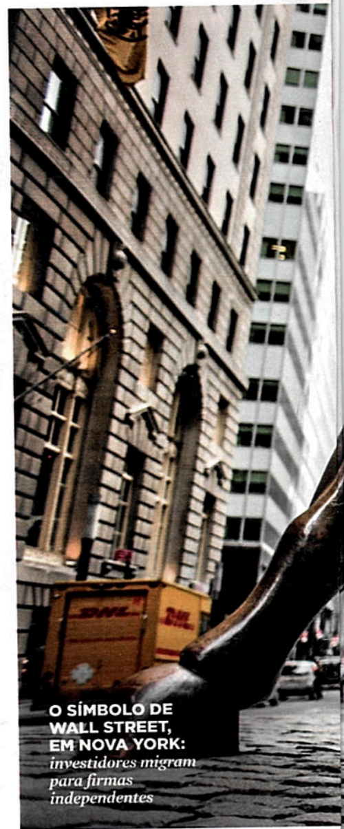
O SÍMBOLO DE WALL STREET, EM NOVA YORK: investidores migram para firmas independentes

— bem longe de Wall Street, o centro financeiro de Nova York. As primeiras consultorias com esse modelo surgiram no fim dos anos 70. Hoje existem 21 000 delas nos Estados Unidos, que juntas administram 1,4 trilhão de dólares, de acordo com a empresa de pesquisa especializada em finanças Cerrulli. Aos poucos, foram roubando espaço das líderes. Mas a crise, que arrastou a reputação de algumas das principais instituições financeiras americanas, está acelerando esse processo. No fim de 2007, quatro instituições detinham 48% da gestão de recursos para o varejo nos Estados Unidos — Bank of America Merrill Lynch, Morgan Stanley, Wells Fargo e UBS. Em 2011, essa participação caiu para 41%. Em